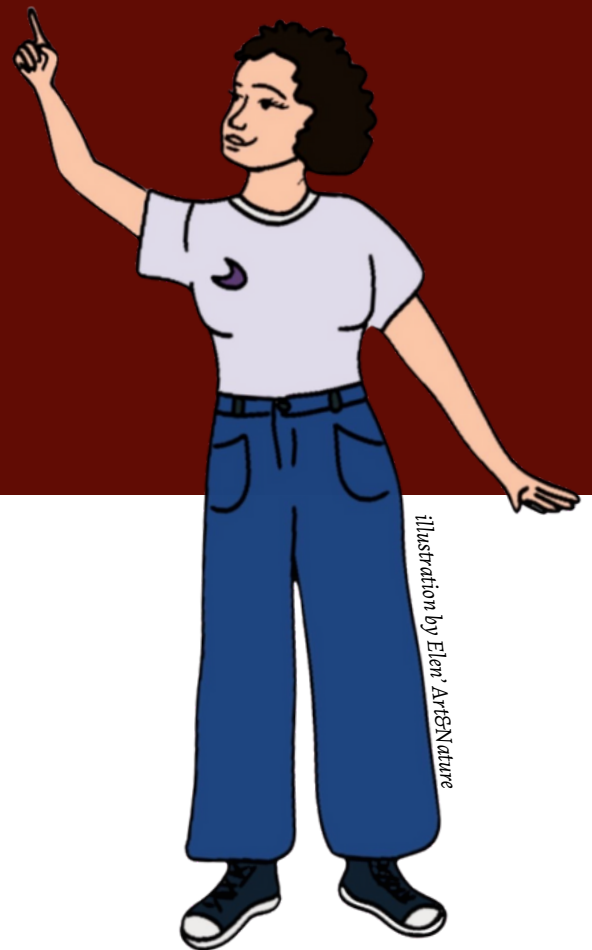
Illustration by Eleni ArisNature

Pour en apprendre plus sur l'adelphité, rendez-vous sur: adelephi.org/charte-adelphite